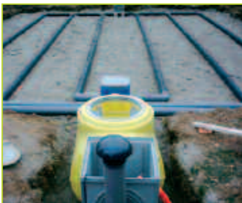
* S.P.A.N.C. : Service Public d'Assainissement Non Collectif