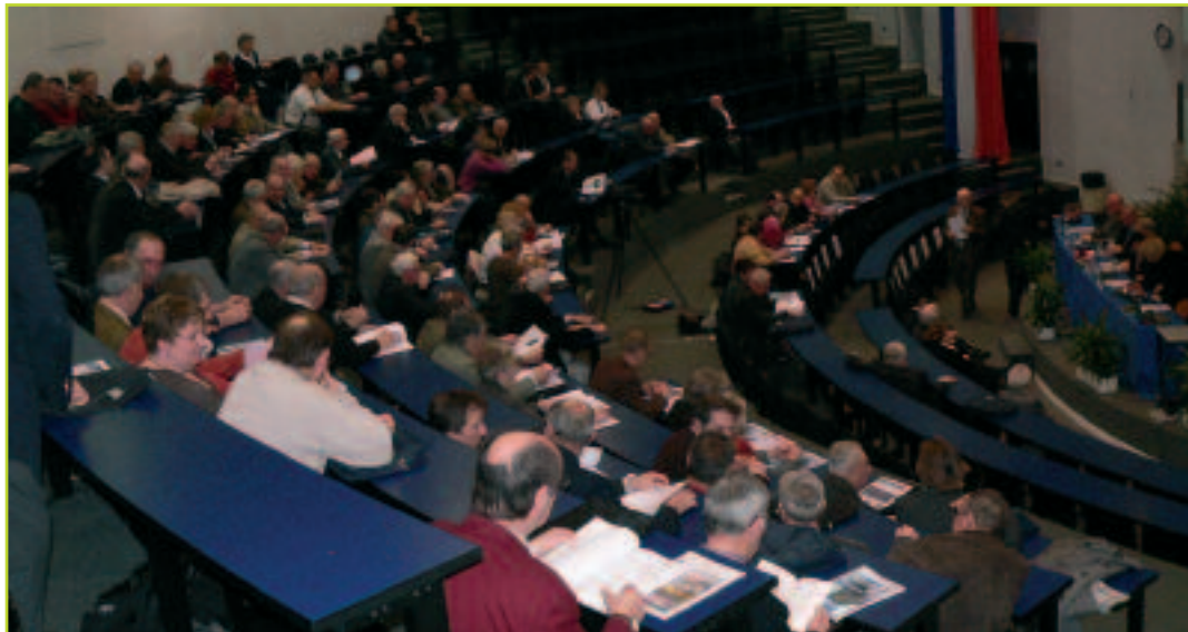
Les maires dans l'amphithéâtre de l'ESIEE

Les habitants sont aujourd'hui plus exigeants. Ils réclament plus de services et pour “l'électeur usager” qui vient vous voir à votre permanence le samedi matin, le maire est identifié comme l'interlocuteur de base qui doit avoir réponse à tout.”