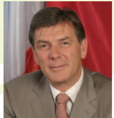
RESEC Amiens © décembre 2009 - RCS 383 687 217

"Je continuerai à travailler et à être vigilant sur ce dossier essentiel pour les finances des collectivités de la Somme en 2010 et en 2011."